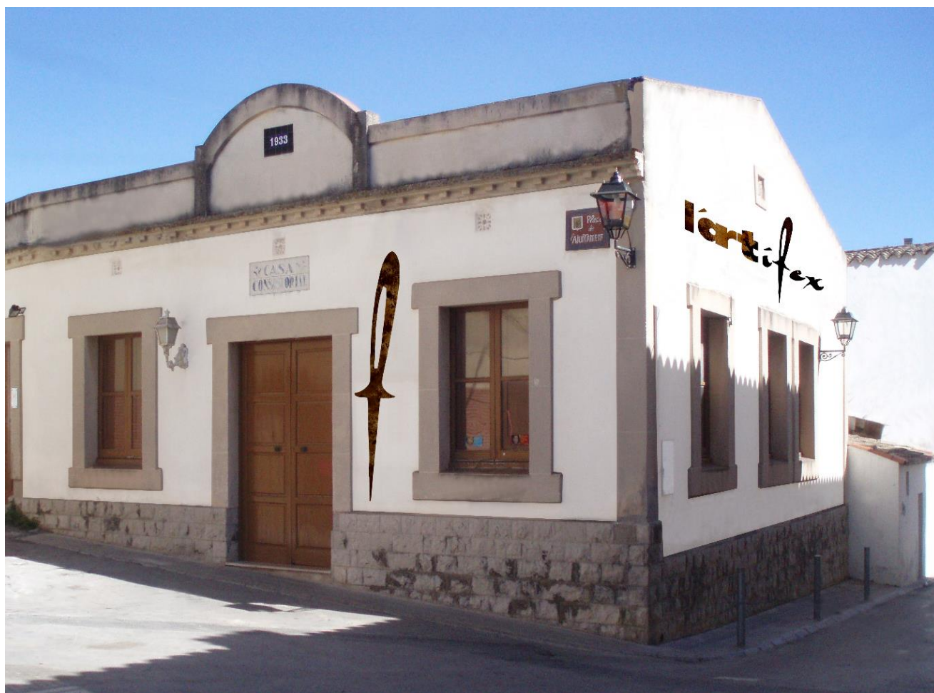
Edifici seu de L'Artífex.

Des de l'Àrea de Promoció Econòmica de l'Ajuntament de Canyelles s'està treballant per iniciar un nou recurs de formació i ocupació, en l'àmbit de l' Artesania , que permeti fomentar l'ocupabilitat de la població aturada del municipi, donar suport a l'esperit emprenedor, que permeti donar a conèixer una marca pròpia i sigui un referent pel que fa a la qualificació professional en oficis artesans. Aquest centre s'anomena L'Artífex.